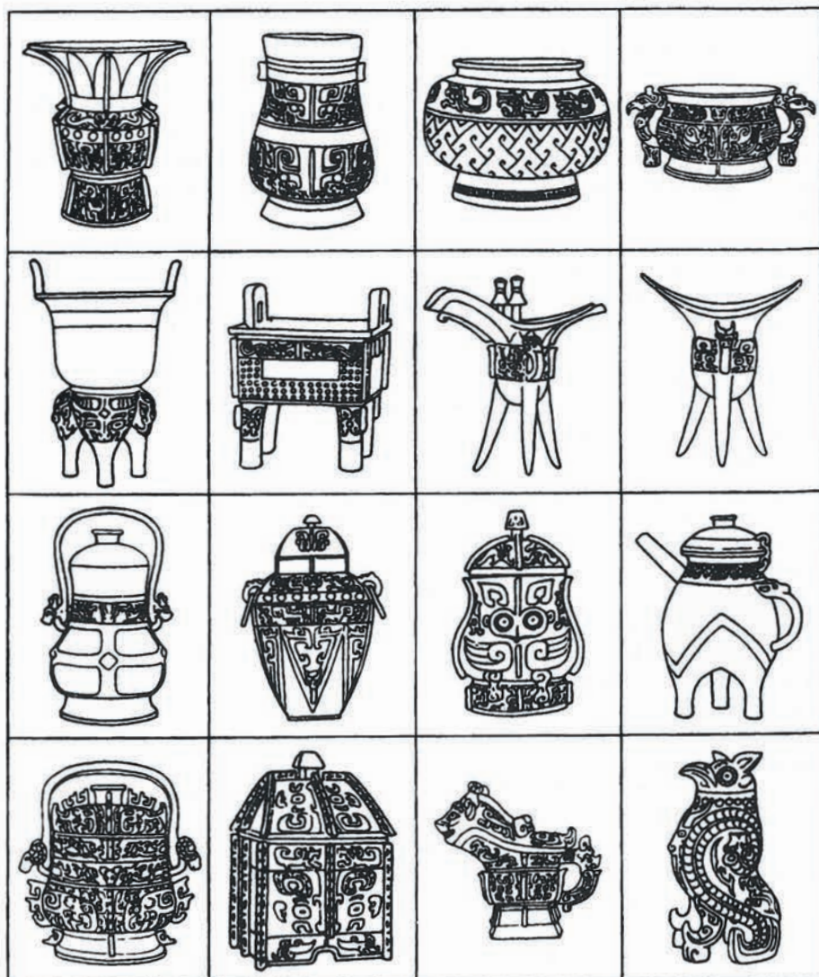
FIGURA 2. Diferentes tipos de vasijas para el culto.

perros (los hombres sacrificados, dispuestos en el exterior de los edificios y orientados hacia afuera, estaban provistos de hachas de guerra, ge , y tenían junto a ellos vasijas de bronce); cinco fosas que contenían carros enjaezados y sus conductores. En algunas fosas se han encontrado restos de hombres decapitados, en otras, cabezas desprovistas de su cuerpo. Finalmente, se han desenterrado grandes tumbas que eran, con toda evidencia, tumbas reales. La mayor parte de esos descubrimientos sugieren la existencia de ritos relacionados con las construcciones y sacrificios de prisioneros de guerra.