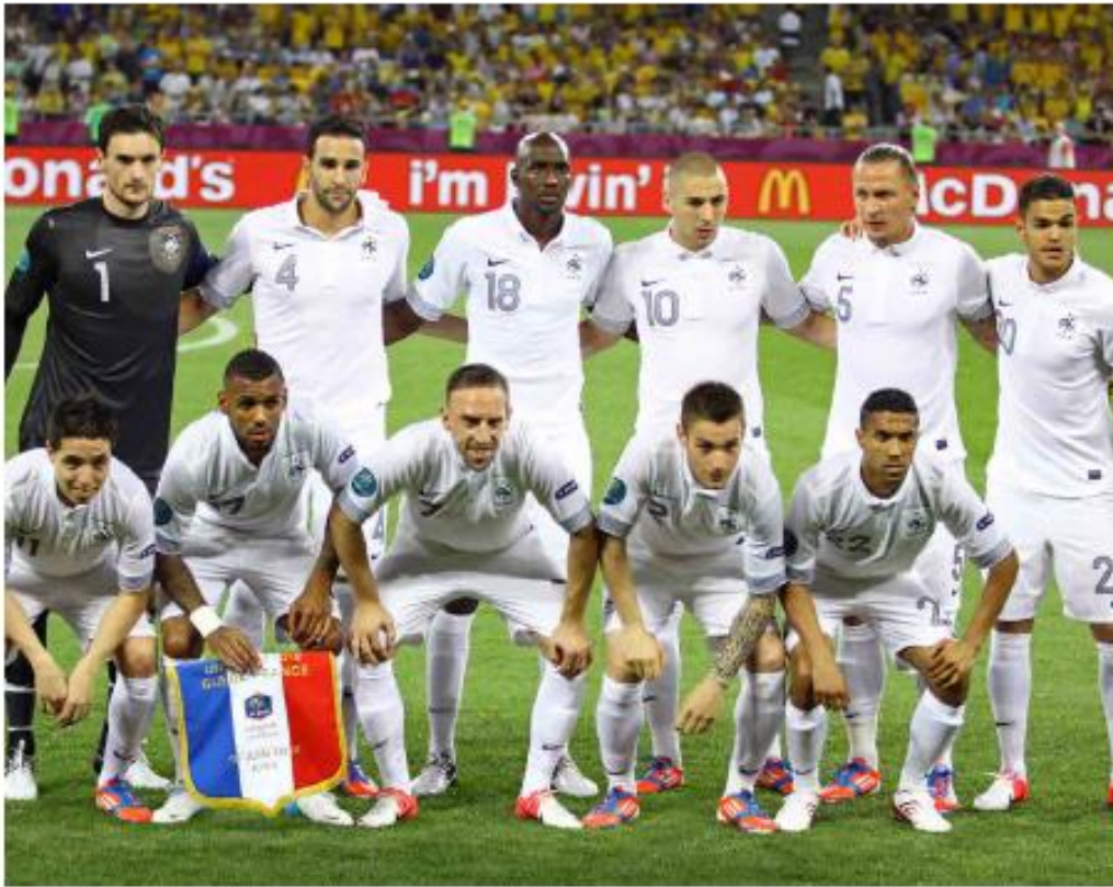
La Eurocopa del 2012 (arriba) y el Mundial del 2014 (abajo) supusieron nuevas decepciones en la trayectoria de Karim Benzema en la selección.