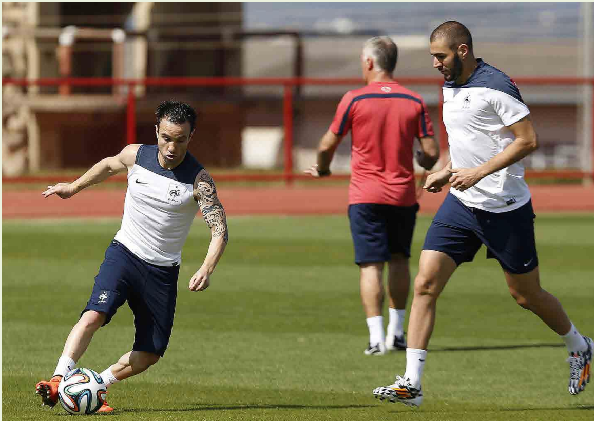
Benzema en una concentración de la selección francesa con su compañero de equipo Mathieu Valbuena

Benzema siempre ha negado las acusaciones e insistió en que solo estaba tratando de ayudar a Valbuena a deshacerse del comprometedor vídeo.