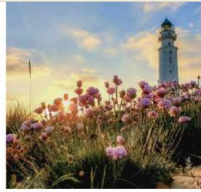
Flipper en la azotea de la Torre Tavira (obviar página anterior). Zahara de la Sierra, en la Sierra de Grazalema. Faro de Trafalgar. Flipper practicando surf en la costa gaditana. Playa en la zona del río Mágico.

La ciudad de Cádiz cuenta con numerosos personajes populares, pero ninguno tan querido como Canelo, un perro pacífico, de mirada triste y afeble. Su historia es un ejemplo de amor perruno. En 1990, acompañaba todos los días a su humano al hospital Puerta del Mar y lo esperaba fuera mientras este se sometía a diálisis. Pero un día el dueño falleció y Canelo se quedó esperándolo. Cuando lo llevaron a la perrera, se deprimió y dejó de comer, así que los gaditanos se movilizaron para que siguiera en la calle, bien vacunado y alimentado. Así, indultado por las autoridades, estuvo doce años custodiando la puerta del hospital, hasta que un coche lo atropelló. Hoy, la calle donde solía estar lleva su nombre y una placa lo recuerda con su efígie y la inscripción: «A Canelo, que durante doce años esperó en la puerta del hospital a su amo fallecido. El pueblo de Cádiz como homenaje a su fidelidad».