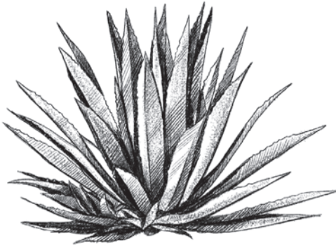
EL AGAVE TEQUILANA.

El tequila se extrae del Agave tequilana o azul. De hecho, el tequila es, en realidad, un tipo de mezcal.