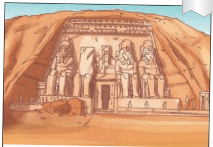
EL TEMPLO DE ABU SIMBEL