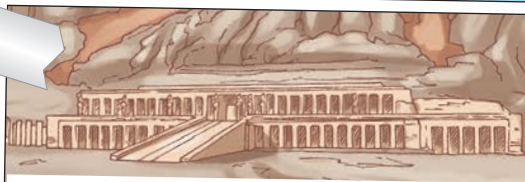
VALLE DE LOS REYES, TEMPLO DE HATSHEPSUT