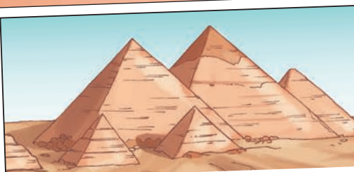
LAS PIRÁMIDES DE KEOPS, KEFRÉN Y MICERINOS EN GUIZA

Los antiguos egipcios dejaron monumentos espléndidos, como las pirámides y la Esfinge de Guiza, los templos de Karnak, Luxor y Abu Simbel, las tumbas de los soberanos del Valle de los Reyes, las del Valle de las Reinas y muchas más. Son obras tan enormes que aún no se sabe cómo las llevaron a cabo los antiguos egipcios con las herramientas de que disponían en aquella época.