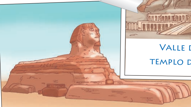
LA ESFINGE DE GUIZA

Los descubrimientos históricos siempre han atraído a los saqueadores de tesoros antiguos. En tiempos de los faraones, los ladrones ya entraban en los monumentos para robar los tesoros que había en su interior. Por eso el acceso a los monumentos más importantes estaba protegido con ingeniosos sistemas que obstaculizaban el paso... ¡los precedentes de los actuales sistemas antirrobo!